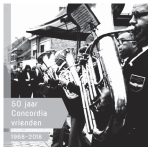
50 jaar Concordia vrienden 1968-2018

Nadien, rond 14.30 uur is het de beurt aan het groot orkest, en trakteert het Harmonieorkest Concordiavrienden u op een feestelijk optreden. Een hapje, een drankje, leuke muziek ... Wat moet een mens nog meer hebben? Om 15.30 uur neemt coverband O'Gazeuse het podium van ons over. Twee uurtjes later, om 17.30 uur is het dan de beurt aan een graag geziene gastartiest op onze concerten, iemand met wie we al drie keer op het podium stonden, een man die kan entertainen en zingen als de beste: Jean Bosco Safari! Doorlopend zijn er ook foodtrucks, een springkasteel, gekke fietsjes, enz. Dit alles is volledig gratis!