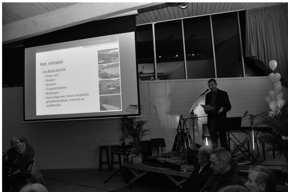
Links onderaan: de Big Belly Band van onze Harmonie Concordiavrienden, die het feest opende. Kalfort kan steeds op hen rekenen voor de vrolijke noot! Boven: de voorzitter spreekt.