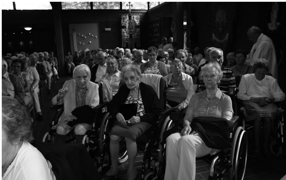
Bovenaan de aanwezigen tijdens de eucharistieviering. Onderaan vrijwilligers in actie in het omgenglokaal.