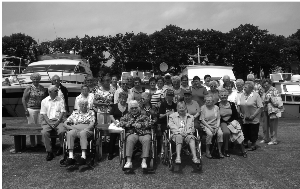
Boven onze Kalfortse Ziekenzorgafdeling op uitstap naar Dessel. Onder de leden van de Kalfortse KVLV op bezoek in Poperinge.