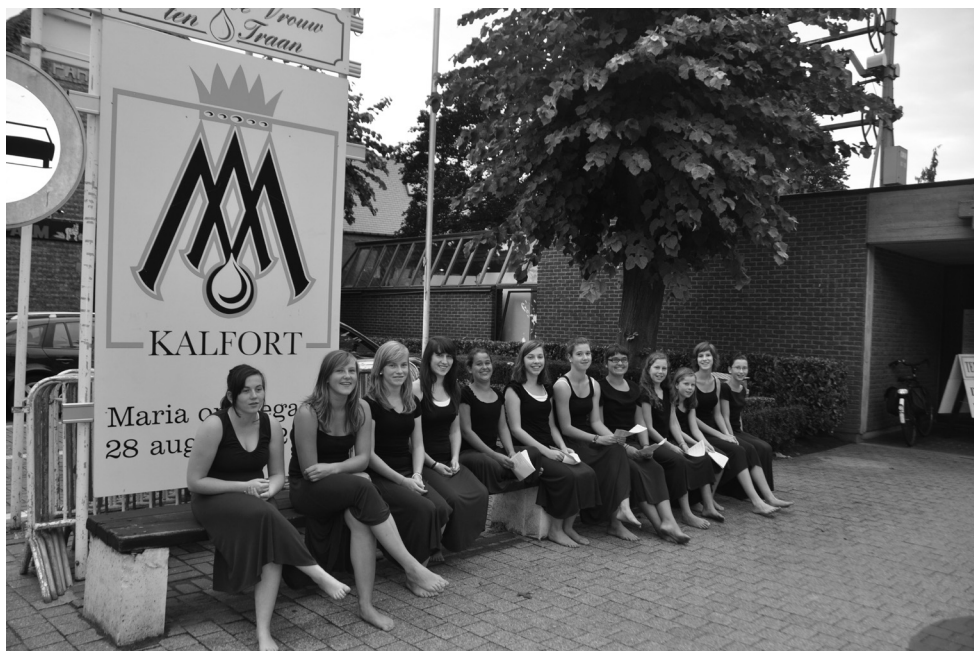
Op vrijdag ging voor de 23ste keer de Maria-avond door. Boven de choreografische groep klaar voor de uitvoering. Onder ons zangkoor in actie.