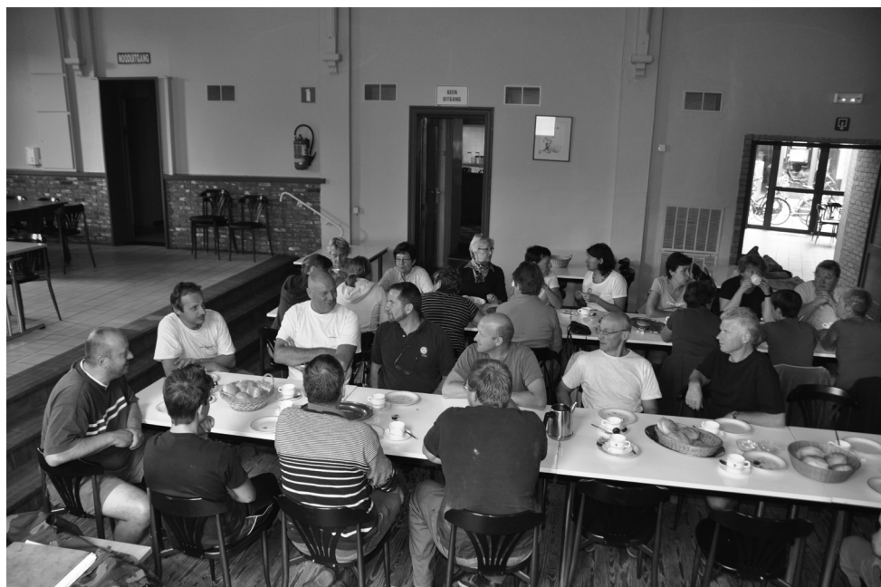
Enkele foto's van de voorbereidingen op zaterdag. Boven de ploeg tijdens de middagpauze. Onder werken aan één van de wagens.