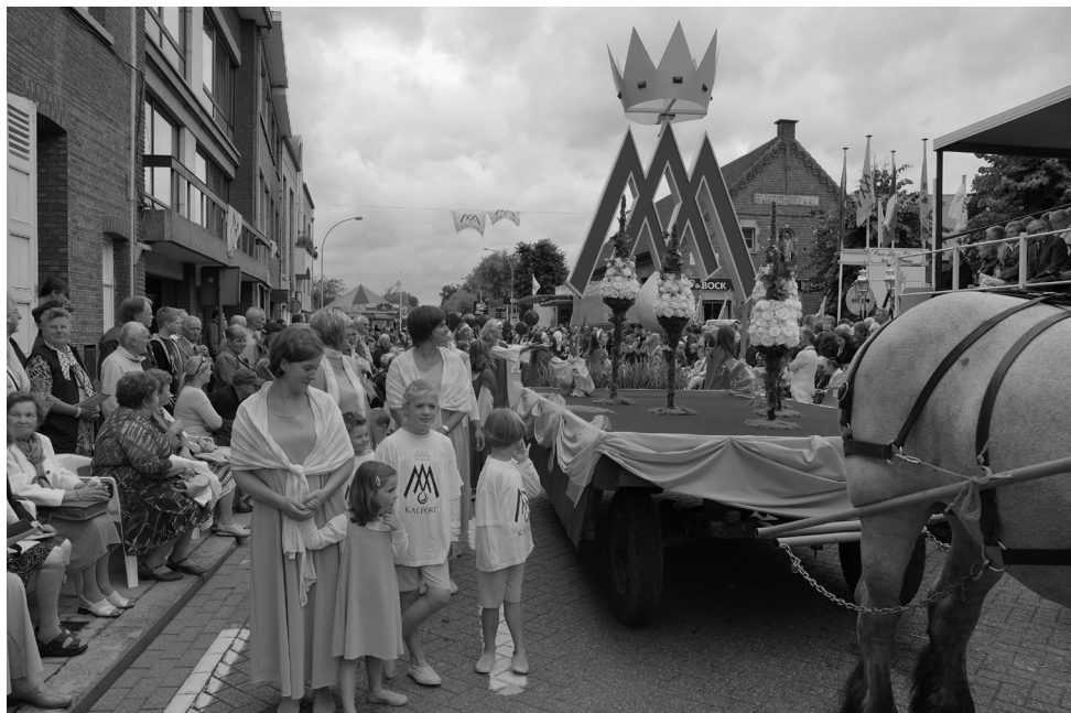
Boven het vertrek met een dreigende hemel in een goed gevuld Kalfortdorp. Onder de terugkomst, blij dat het droog is gebleven en tevreden om het goede verloop.