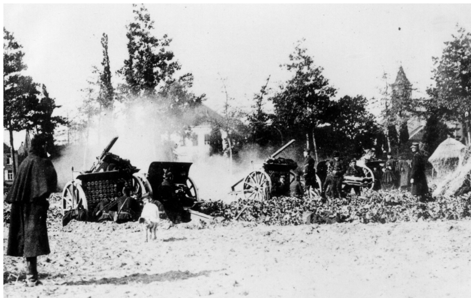
Actie van Belgische artillerie bij Mechelen.