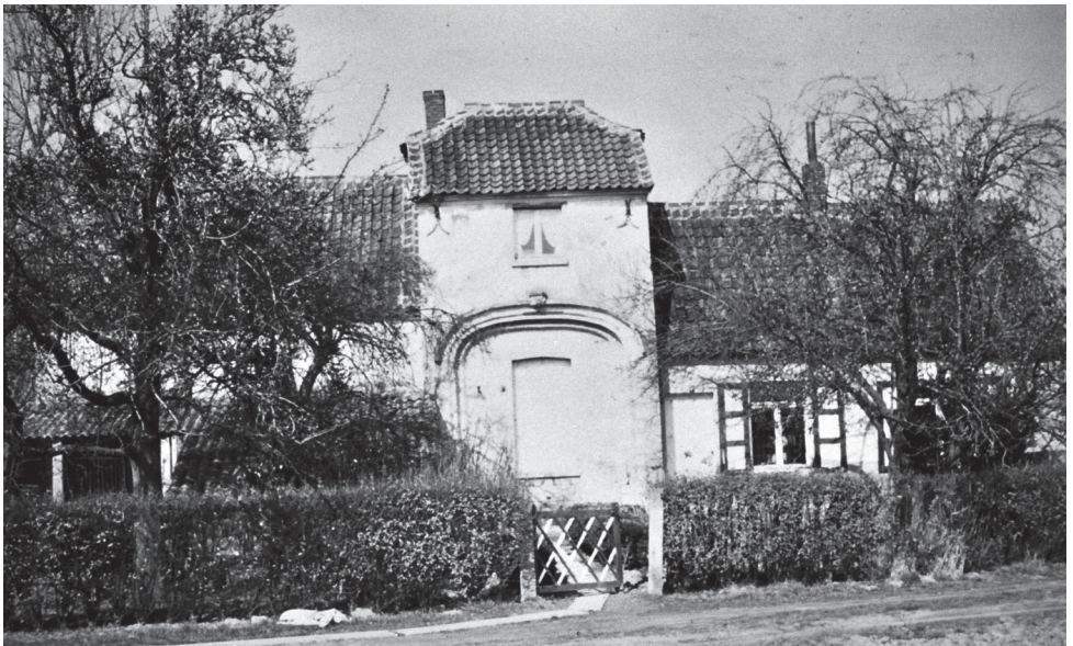
Het Echelpoelhof in de latere Alfons Meersmansdreef.