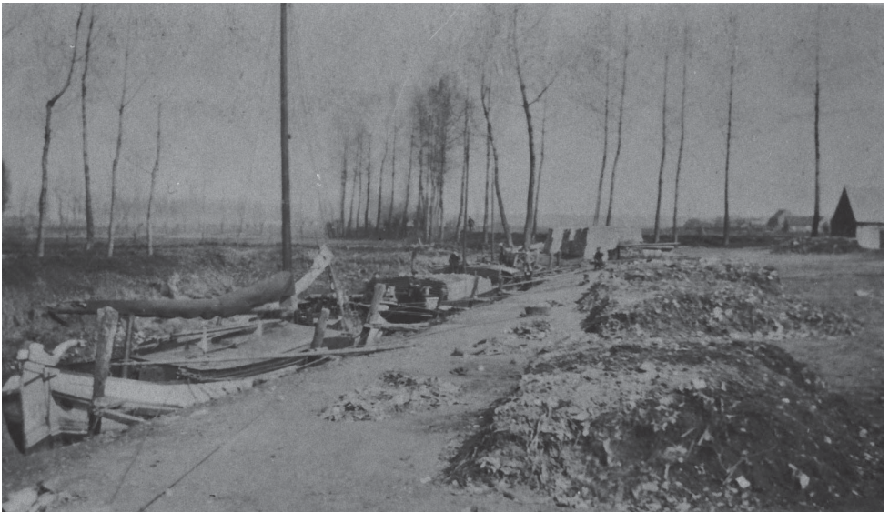
De Vliet op de Kleine Amer.

Niet enkel de Kleine, Grote en Eikse Amer hadden het hard te verduren. Ook Sint-Amands, Mariekerke, Hingene, Wintam, Weert, Boom, Rumst,