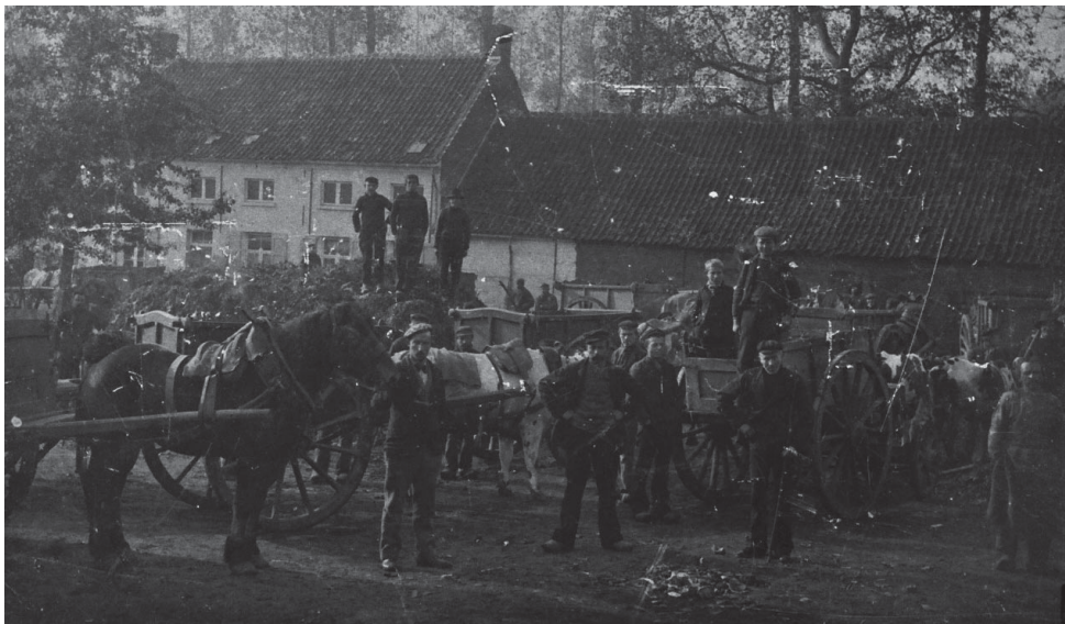
De kaai Marnef-Feremans op de Kleine Amer.

“De sterk noordwestelijke wind, die vooral zondag een buitengewone massa zeewater in de Schelde joeg, deed weer voor rampen vrezzen, vooral daar het die dag nieuwe maan was, doch aan de boorden der Schelde en Rupelstromen hadden geen dijkbreuken plaats. Ons rivierke “de Vliet” dat bij dergelijke tijen altijd krachtig zwelt, is ditmaal ook weer al te driest, al te driftig, aan ‘t werk geweest. Onze lezers herinneren zich de dijkbreuk van maart 1906, toen op de Kleine Amer, tegenover ‘t huis gezegd “de Hel” de dijk op een lengte van een 20-tal meters wegspoelde en er aanmerkelijke schade werd aangericht. De herstelling van den dijk vergde alsdan een som van ruim 5000 fr. en thans is zondagnamiddag, rond 4 ure, aan dezelfde eigendom nevens de vernieuwde dijk door de woeste kracht van het water een nieuwe bres geslagen van een 12-tal meters. Een diepen kuil is wederom gespoeld, een boom omgerukt en het achterliggende land gedeeltelijk met plaatsand bedekt. De kassei van de Kleine Amer is op sommige