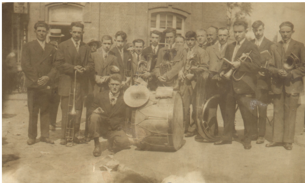
De fanfare De Verenigde Vrienden.