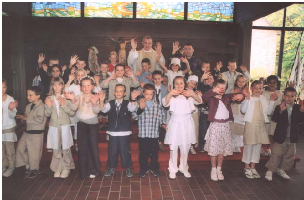
Eerste communicanten in Kalfort. Bovenaan de groep van de gemeenschapsschool; onderaan de groep van de gemeenteschool.