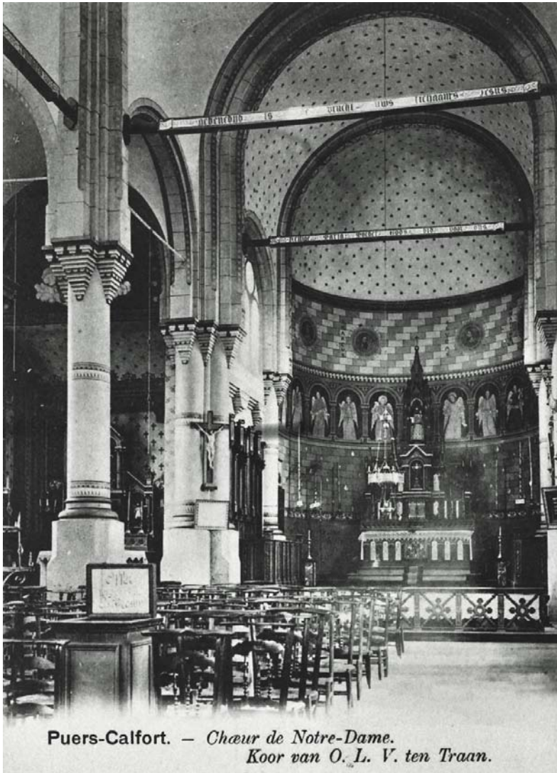
Puers-Calfort. — Chœur de Notre-Dame. Koor van O. L. V. ten Traan.